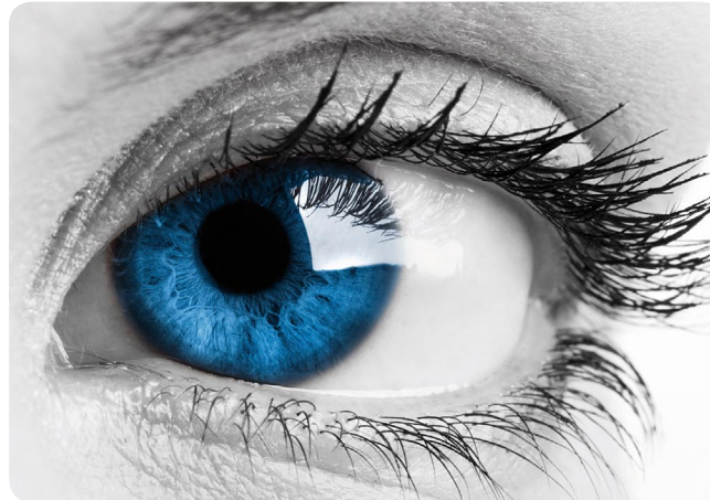
Abbildung eines gesunden Auges

Bestandteile eines intakten Tränenfilms sind neben Fetten, Mucin und dem wässrigen Teil besonders auch Mineralien und Salze, mit denen die Hornhaut Ihres Auges versorgt wird.